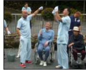
10月11日 『マス釣り』を楽しみ、釣った魚を美味しく頂きました。