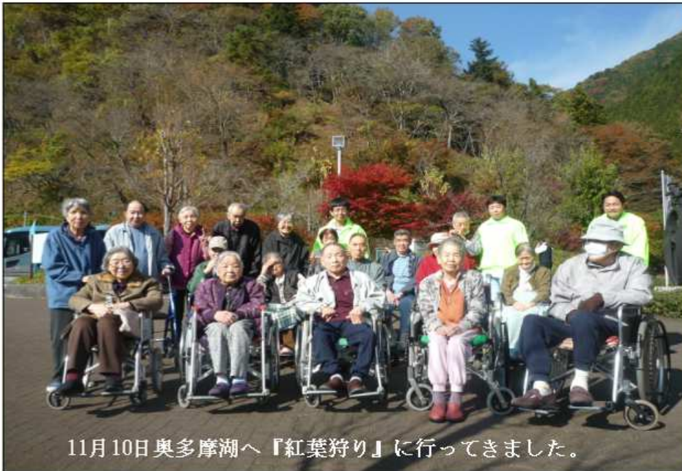
11月10日奥多摩湖へ『紅葉狩り』に行ってきました。