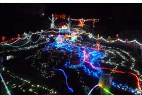
12月21日 『大丹波イルミネーション』見学