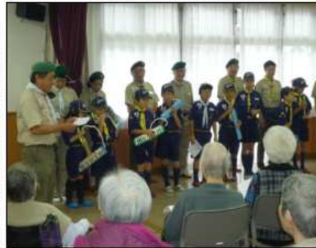
11月23日『杉並ボーイスカウト』による施設訪問