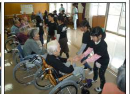
12月4日 氷川小学校1・2年生による施設訪問 ♪歌や踊りで楽しいふれあいの時間になりました♪