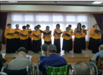
11月19日『コーラス山吹』の皆様による施設訪問