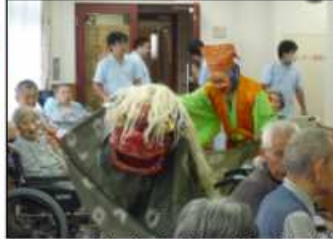
羽黒三田神社囃子振興会による郷土芸能(お囃子)