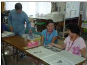
新聞の袋作りを教わりました

今後も地域と連携してボランティアを受け入れ、交流を図る事で利用者皆様の生活がより充実したものになるように活動していく予定です。