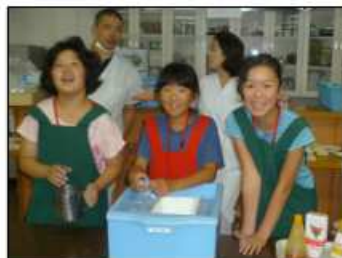
喫茶会のお手伝い