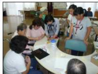
絵手紙作成のお手伝い