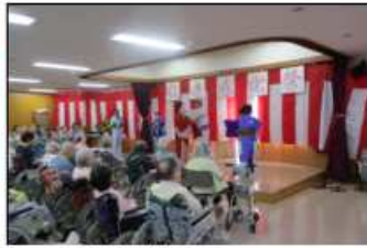
扇和会による日本舞踊