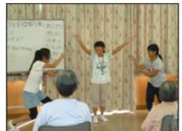
笑顔いっぱいの体操です