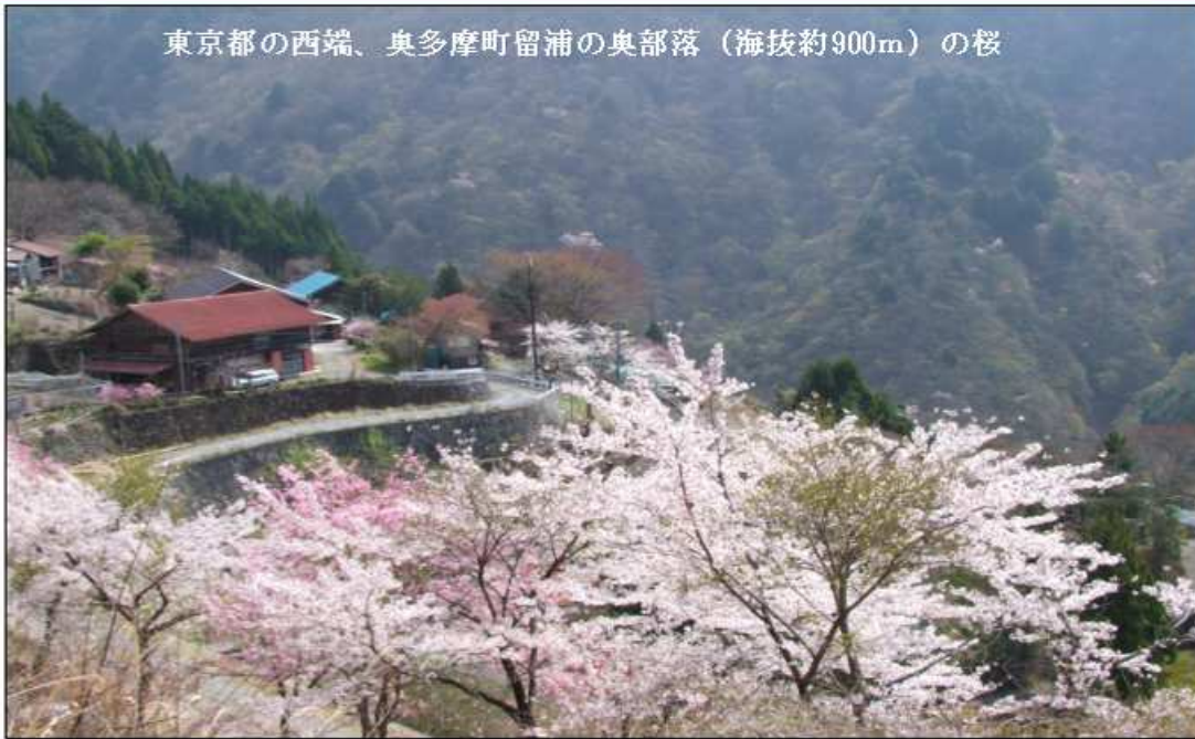
東京都の西端、奥多摩町留浦の奥部落（海拔約900m）の桜