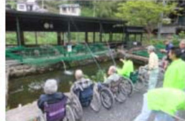
六月八日 『マス釣り』

本広報誌に記載しております、お名前・写真につきましてはご本人、若しくはご家族より承諾を頂いた上で掲載しております。