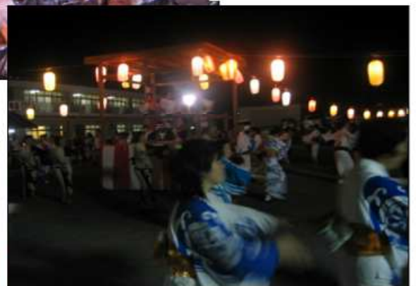
8月1日 寿楽荘盆踊り大会