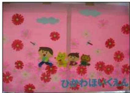
今年も氷川保育園より「敬老お祝いポスター」を頂きました。