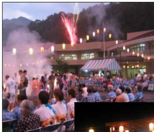
8月1日(日)に開催された『寿楽荘盆踊り大会』には大勢の方にお集まり頂き年に一度の行事を楽しまれました。