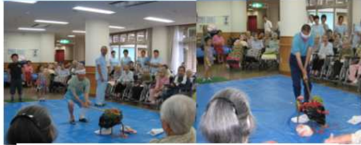
7月21日・8月18日 スイカ割り 氷川保育園児を招き利用者も一緒になって楽しめました。