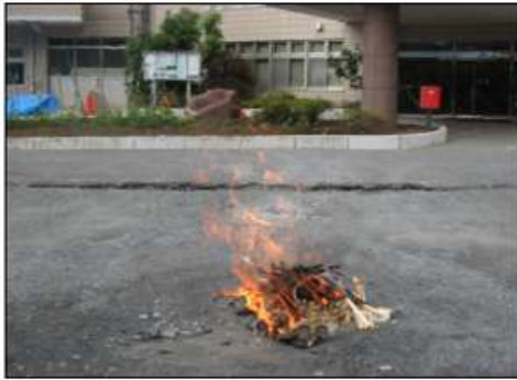
お盆供養（迎え火・送り火） 施設でお亡くなりになった利用者の方々を偲んで供養させて頂いております。