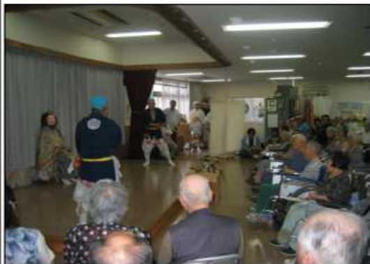
慰問 7月31日 『神庭お神楽』