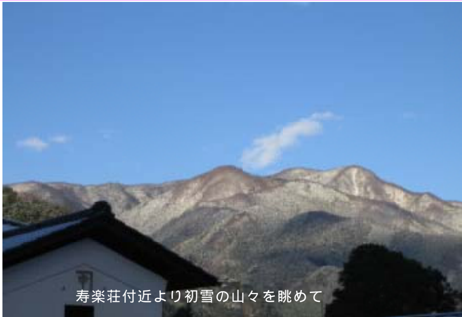
寿楽荘付近より初雪の山々を眺めて