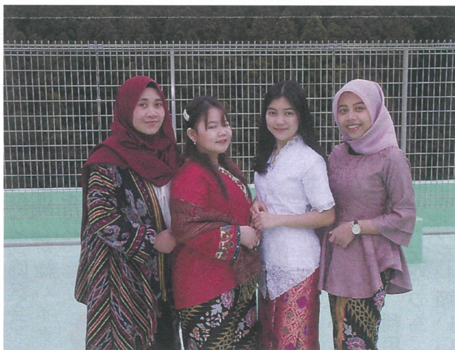
成人を迎えた技能実習生4名

成人を迎え、これから大人としての自覚を持ち、自分の目標に向かって努力を続ける。そして、今まで育ててくれた両親に孝行し、今まで支えてくれたすべての人達へ感謝の気持ちを伝える。私らしくこれからの人生を生きていきたいと思う。