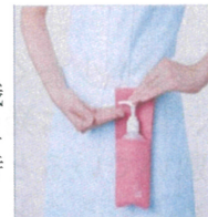
【ウエストポーチタイプ】

感染症予防対策として、全職員が専用の携帯用ポシェットにアルコールジェルを入れて随時消毒を行っています。