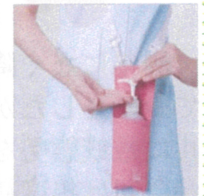
【ショルダータイプ】