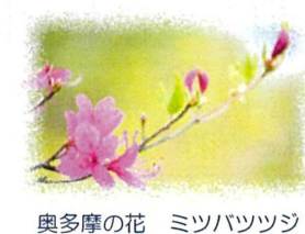
奥多摩の花 ミツバツツジ