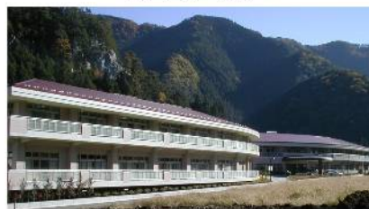
寿楽荘前景 西側面より