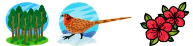
奥多摩の木・鳥・花[杉・ヤマドリ・みつばつつじ]