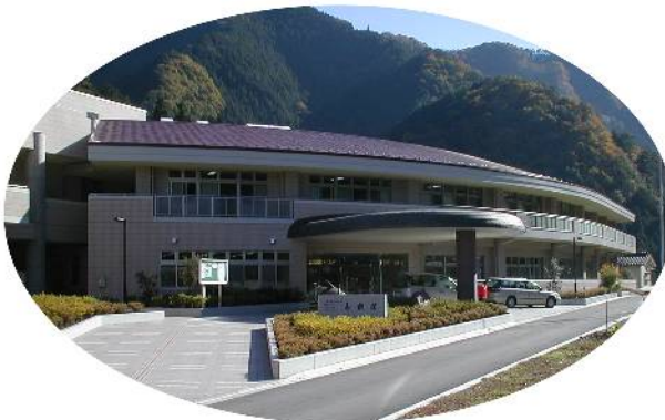
介護老人福祉施設 寿楽荘 (特別養護老人ホーム)