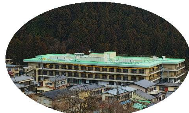
介護老人福祉施設 琴清苑 (特別養護老人ホーム)