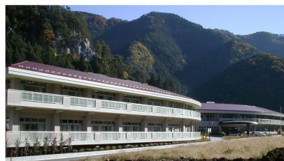
寿楽荘前景 西側面より