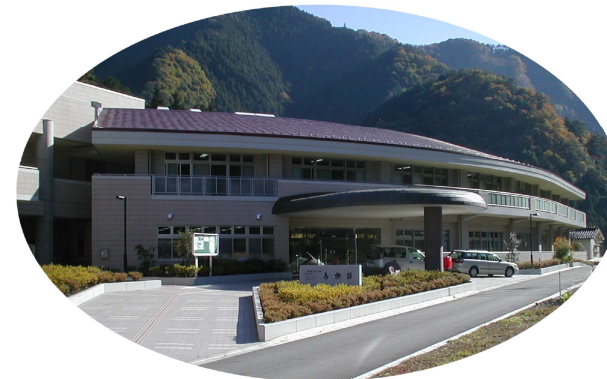
介護老人福祉施設 寿楽荘 (特別養護老人ホーム)