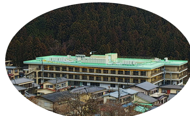
介護老人福祉施設 琴清苑 (特別養護老人ホーム)