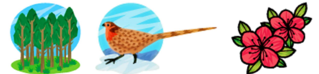
奥多摩の木・鳥・花[杉・ヤマドリ・みつばつつじ]